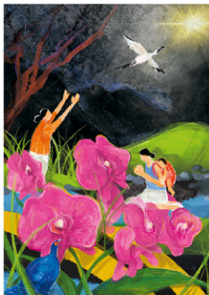
Das Titelbild zum Weltgebetstag 2023 stammt von der Künstlerin Hui-Wen Hsiao. Die Frauen auf dem Gemälde sitzen an einem Bach, beten still und blicken in die Dunkelheit. Trotz der Ungewissheit des Weges, der vor ihnen liegt, wissen sie, dass die Rettung durch Christus gekommen ist.

Über Länder- und Konfessionsgrenzen hinweg engagieren sich Frauen seit über 100 Jahren für den Weltgebetstag.