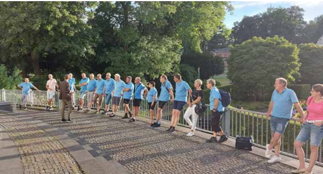
Am 5. Juli hieß das Ziel Bad Oeynhausen inkl. Stadtführung.