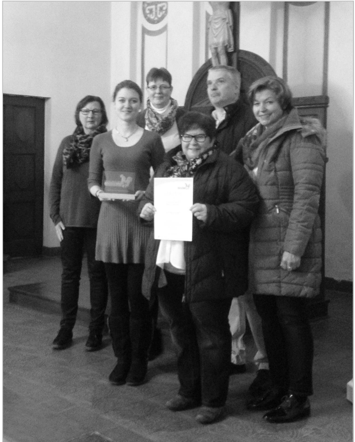
Das Mitarbeiterteam der Ferienspiele